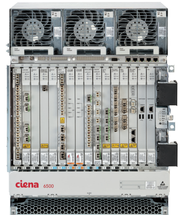
그림 1. 6500-14 100G ROADM 구성

대역폭이나 연결에 대한 수요 변동에 따라 네트워크 요소들을 맞춤화하여 2.5G에서 100G 교환까지 그리고 DWDM 애플리케이션을 지원할 수 있습니다. 회선과 장비에 대한 다양한 보호 옵션을 제공하기 때문에 서비스 공급자는 SLA(서비스 수준 계약)를 세분화하고 서비스 상품을 차별화할 수 있으며 이러한 이점은 고객 기반 확대로 이어집니다.