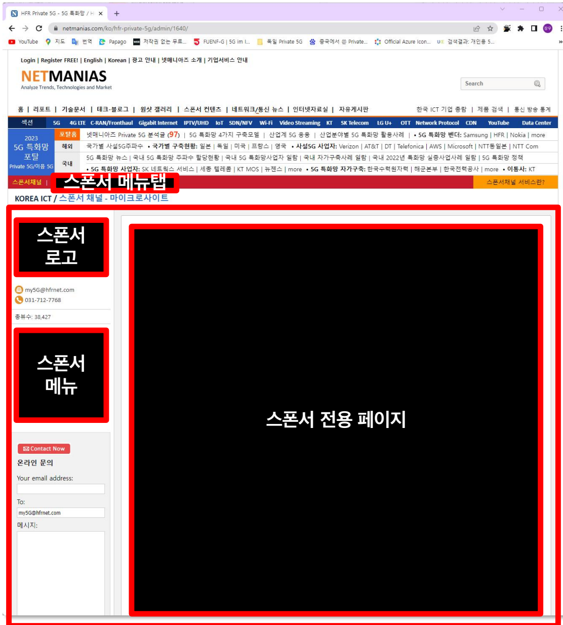
넷매니아즈 사이트내 스폰서 전용 마이크로사이트

넷매니아즈 사이트내에 스폰서의 전용 마이크로 사이트를 기획/제작/호스팅/업데이트해주는 서비스